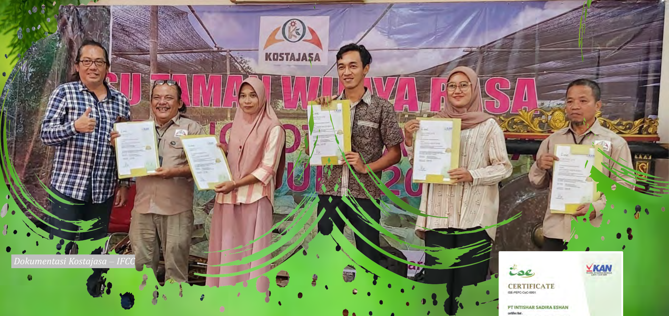
Dokumentasi Kostajasa – IFCC

Koperasi Serba Usaha Taman Wijaya Rasa ( KOSTAJASA ) merupakan organisasi berskala kecil-menengah di Indonesia yang berhasil meraih Sertifikat CoC-PEFC